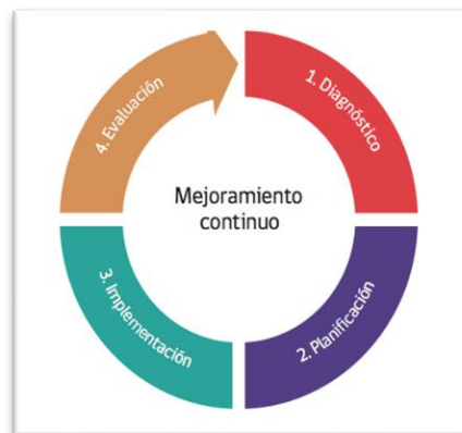
Ciclo de Mejoramiento continuo

Este ciclo comienza con una etapa de diagnóstico institucional, que implica un análisis de los resultados institucionales y una evaluación del nivel de calidad de las practicas institucionales y pedagógicas. Continúa con la planificación e implementación de una propuesta de mejoramiento que contiene metas, objetivos, indicadores de seguimiento y acciones. Este ciclo culmina con un proceso de evaluación en que la comunidad educativa valora lo alcanzado y proyecta nuevos desafíos para cada año.